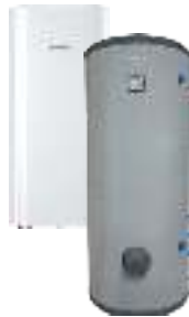
Комбинированные (косвенные) водонагреватели