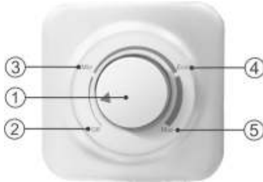
Рисунок 2. Механическая панель управления

Рисунок 2: 1 – ручка управления водонагревателем со стрелкой индикатором, 2 – зона «off» включения/выключения водонагревателя, 3 – зона регулировки температуры «min», 4 – зона регулировки температуры «eco», 5 – зона регулировки температуры «max».