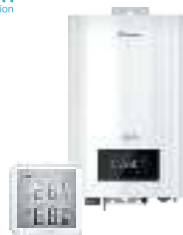
Электрические котлы и комнатные термостаты